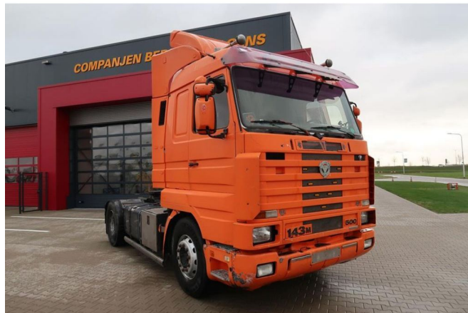
Scania R143-500 V8 143-500 Streamline