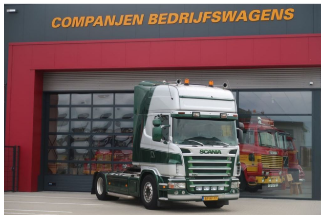
Scania R164-480 V8 164 480 Original Dutch Truck KING OF THE ROAD 4x2