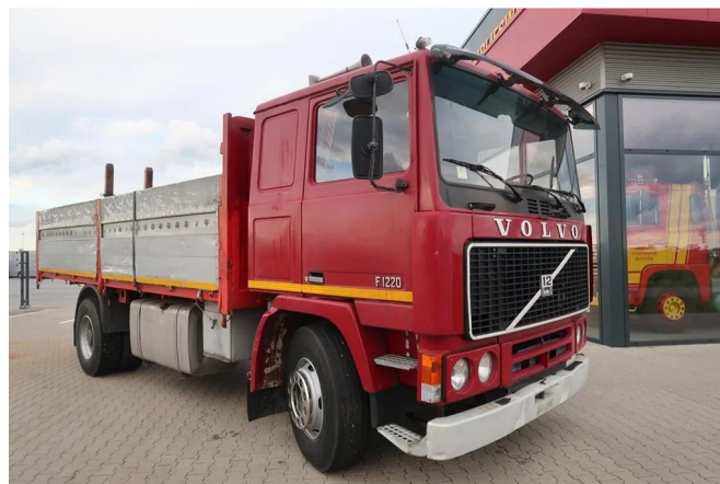
Volvo F 12 F 12-20