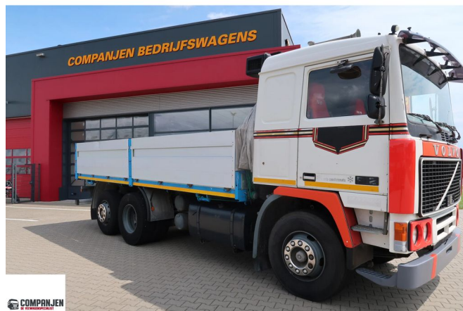
Volvo F 12.360 F 12.360 6x2