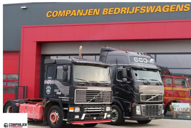
Volvo F 16.485 F16 - 485 - 1989 - Oldtimer