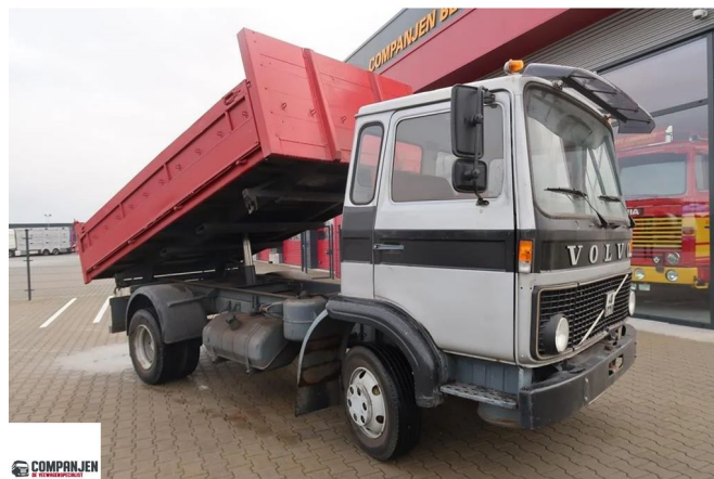
Volvo F F 408 - 1980 - Tipper - Oldtimer