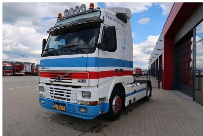
Volvo FH 16 FH16-520