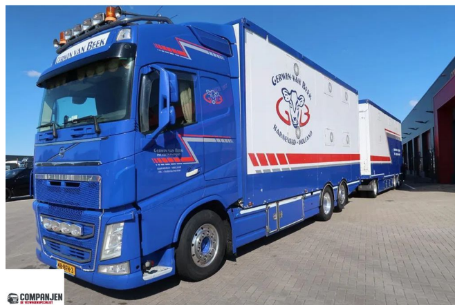
Volvo FH FH 500 - Livestock transport