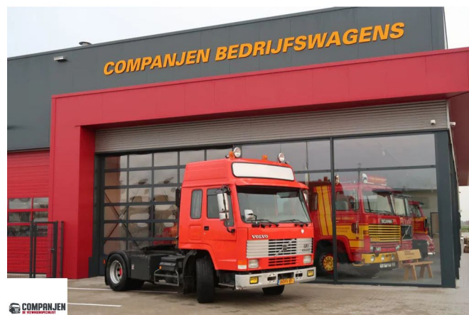
Volvo FL 7.260 FL7.260 42T - 1997 - Globetrotter rooftop