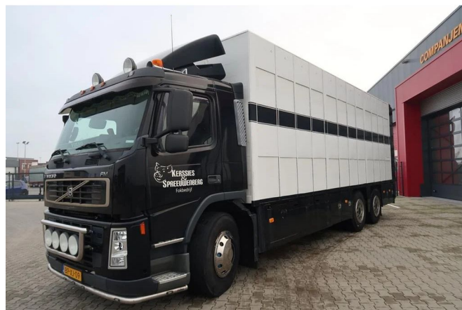
Volvo FM 12.340