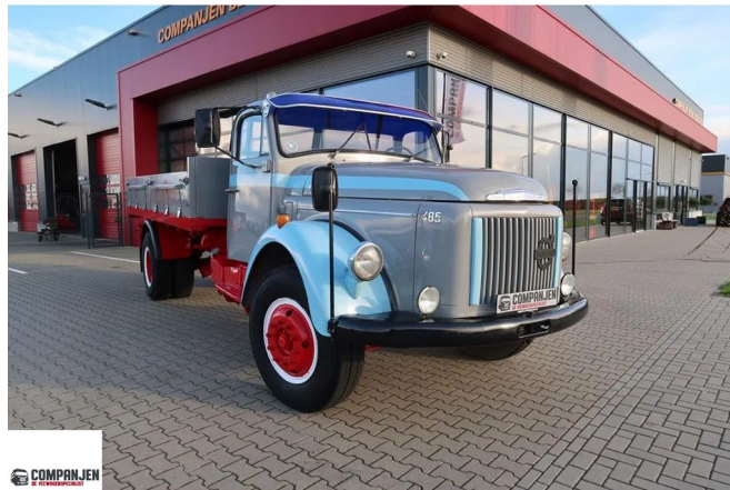
Volvo L L 485 - 1963 - Oldtimer