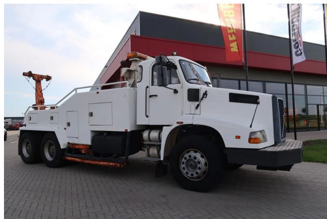
Volvo VNL NL 10 Takel en Berging wagen 6x4