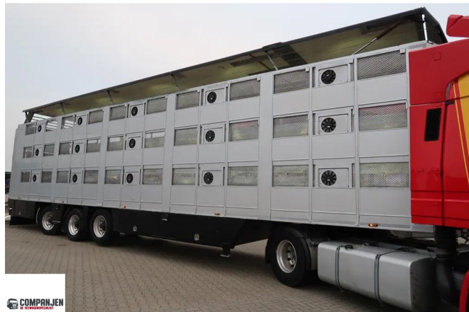
CUPPERS LVO 12-12 ASL