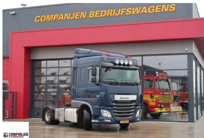
DAF XF 460 H4ENB - 2016 - Euro 6 - Walking floor + tipper hydraulic 4x2