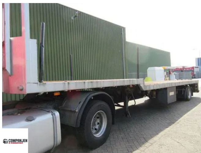
E.S.V.E O4/DA - E.S.V.E - 1989