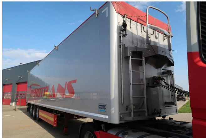
Knapen Trailers K200