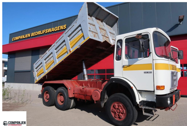
MAN 33 33-365