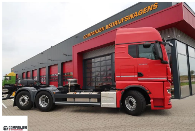
MAN TGX TGX 26.470 - BDF - Retarder - 2021- Steering axle