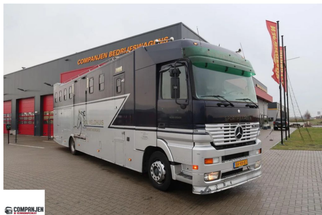
Mercedes-Benz Actros 1835 Horse transport