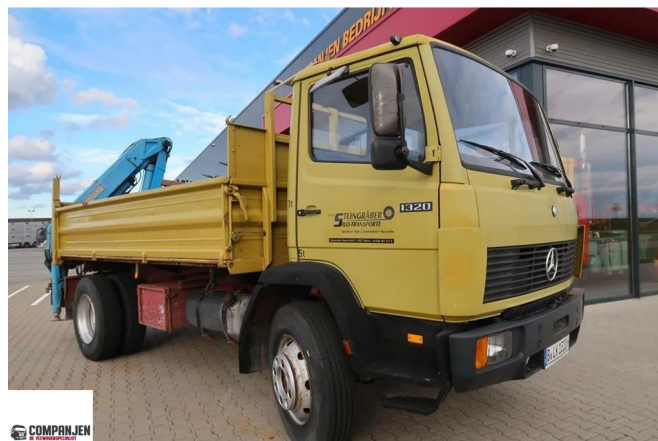
Mercedes-Benz SK 1320 SK1320 - 1988 - Side tipper - Meiller crane -... 4x2