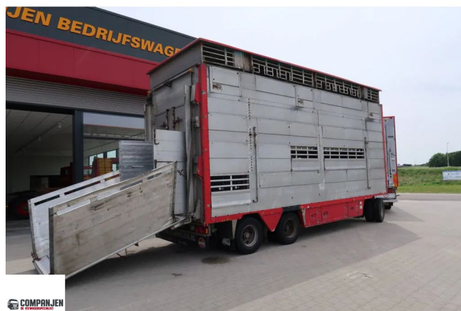
Pezzaioli RBA31 - 2002 - Livestock transport - 2 Floors