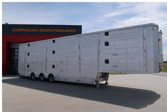
Pezzaioli SBA 31