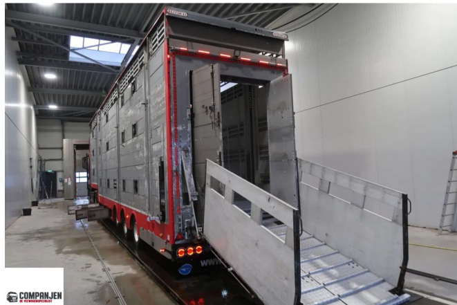
Pezzaoli SBA 31