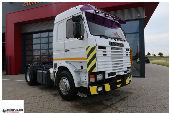
Scania R143-450 V8 143-450 Topline - 1989 - Retarder