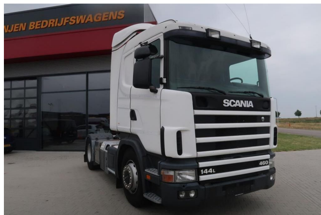
Scania R144-460 V8 144L - 460