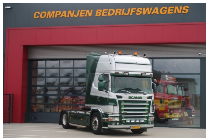
Scania R164-480 V8 164 480 Original Dutch Truck KING OF THE ROAD 4x2