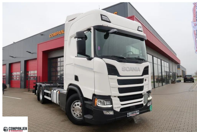
Scania R450 NGS R450