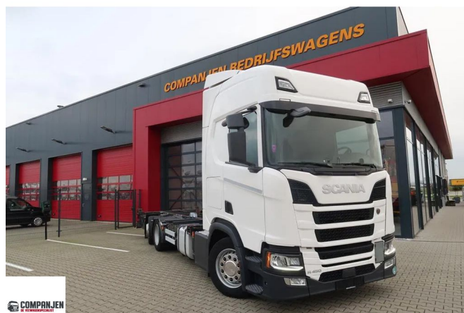
Scania R450 NGS R450