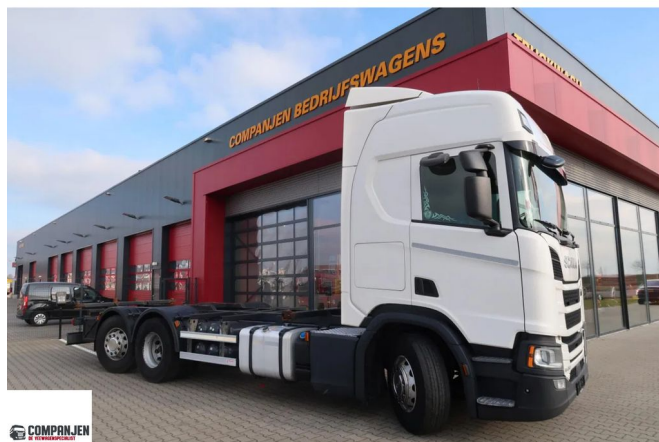
Scania R450 R450- BDF - Steering axle