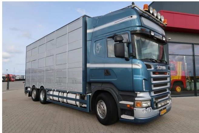
Scania R500 V8 R500LB6X2*4MLA