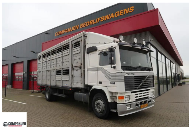
Volvo F 10.320 F10