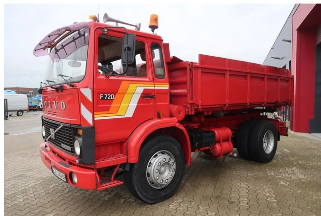
Volvo F 7 F 720