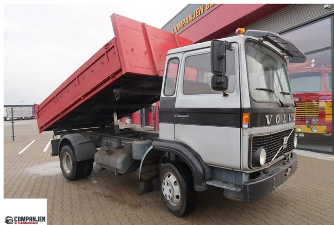
Volvo F F 408 - 1980 - Tipper - Oldtimer