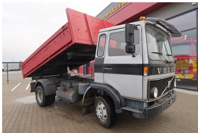
Volvo F F 408