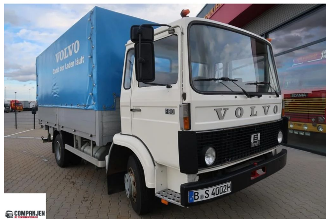
Volvo F F6-10 - 1981 - Tarpaulin with loading ramp - Oldtimer