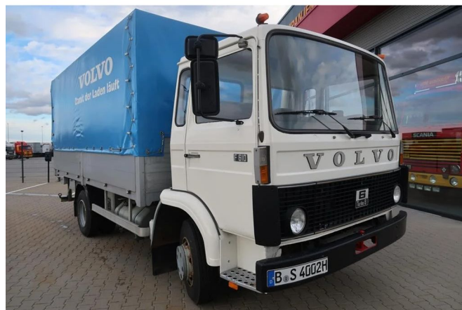
Volvo F F6-10