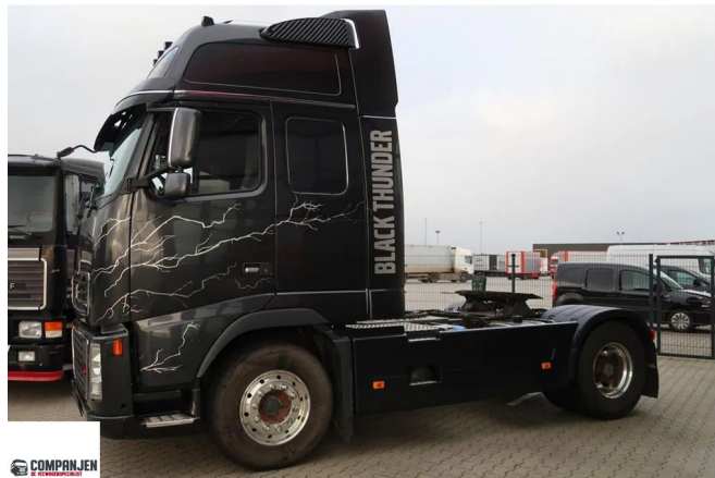
Volvo FH 16.660 FH 16