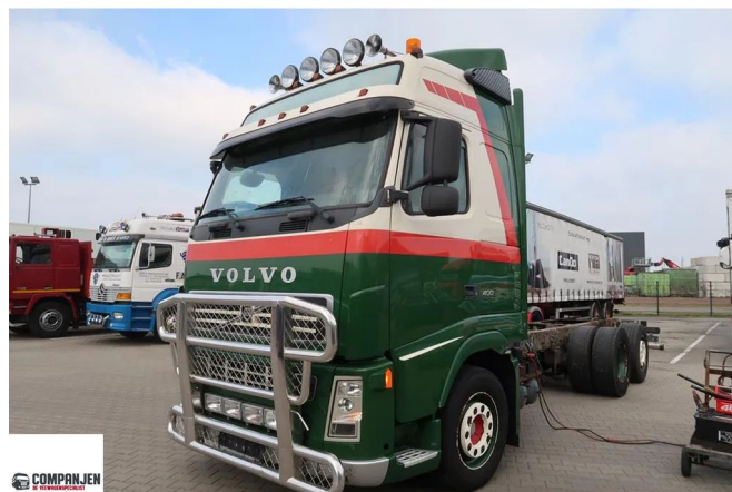
Volvo FH FH 440 - Chassis Cabine