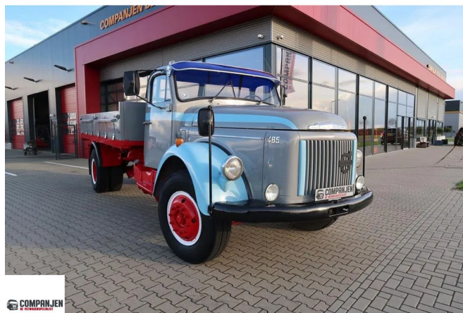
Volvo L L 485 - 1963 - Oldtimer