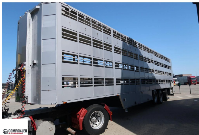
CUPPERS LVO 12-27 ASL MMBS