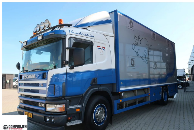
Scania P114-380 114G