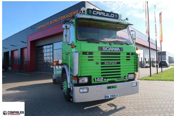
Scania R142-V8 R 142 MA