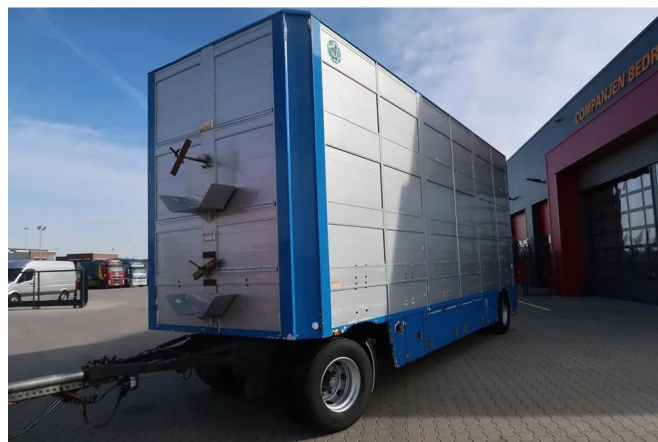
Berdex AV 1010