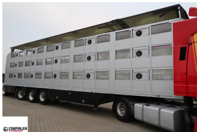
CUPPERS LVO 12-12 ASL