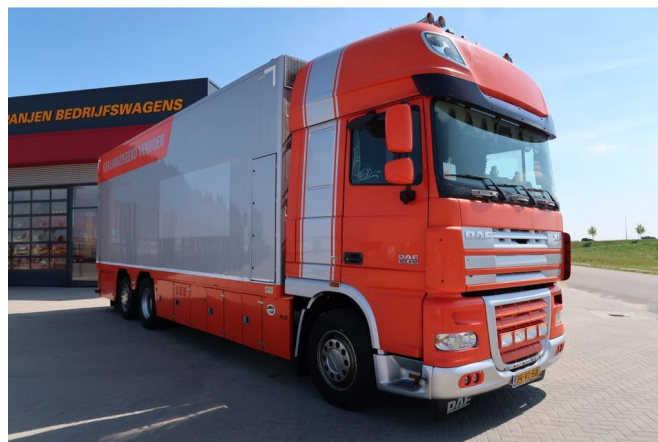
DAF XF 105.410 XF 105