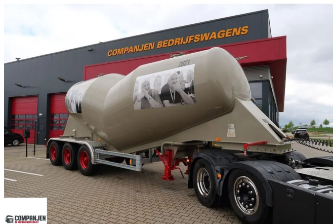
Diversen Filliat XTR32E2 - 1986 - Oldtimer - bulk cement trailer