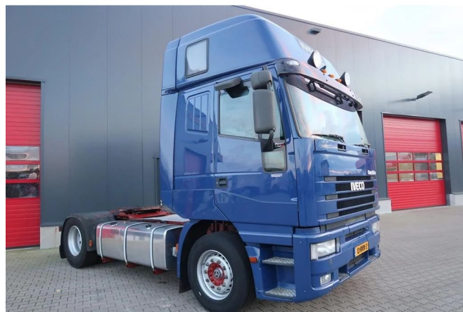
Iveco Eurostar 190.48