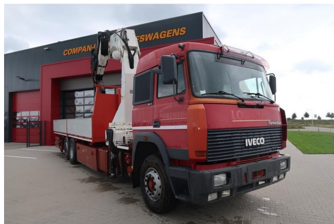
Iveco Turbostar 190.36 190-36