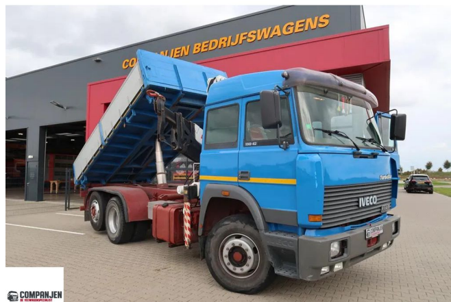
Iveco Turbostar 190.42 Turbostar 190.42 - Tipper with crane - Bonfigliol... 6x2