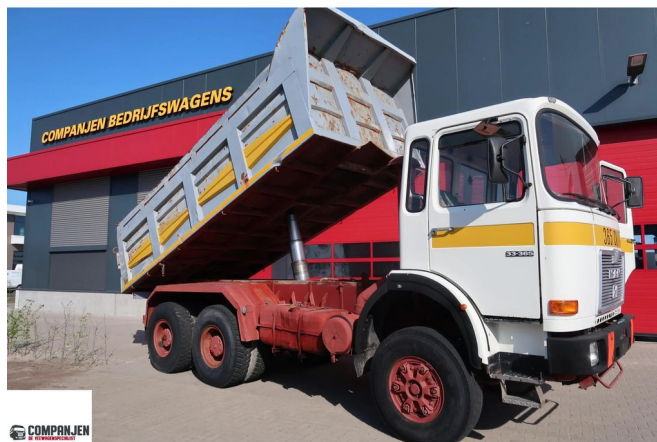
MAN 33 33-365